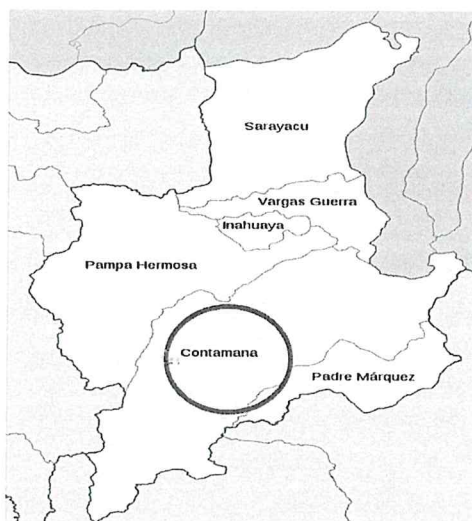
Fig. 03: LOCALIZACIÓN DE LA ZONA DEL PROYECTO