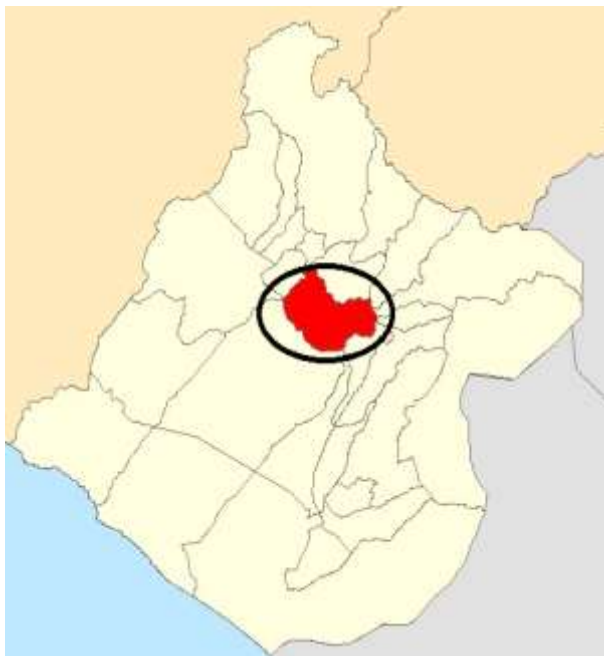
Grafica N° 1: Mapa de macro localización del proyecto

Distrito : Heroes Albarracin - Chucatamani Provincia : Tarata Región : Tacna