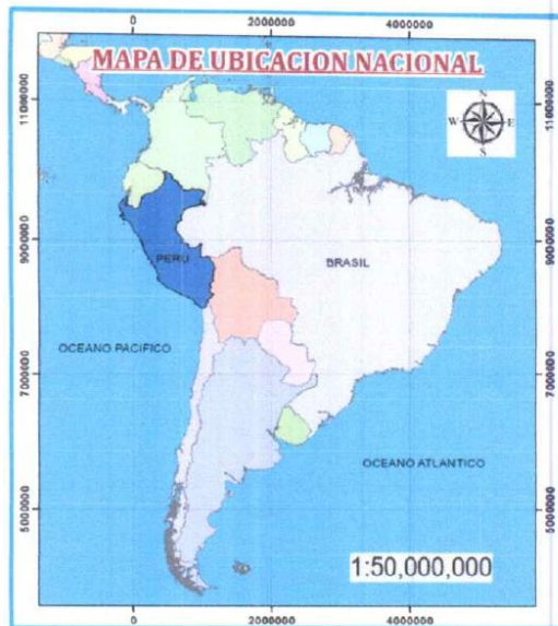
Mapa N° 01: Ubicación Nacional