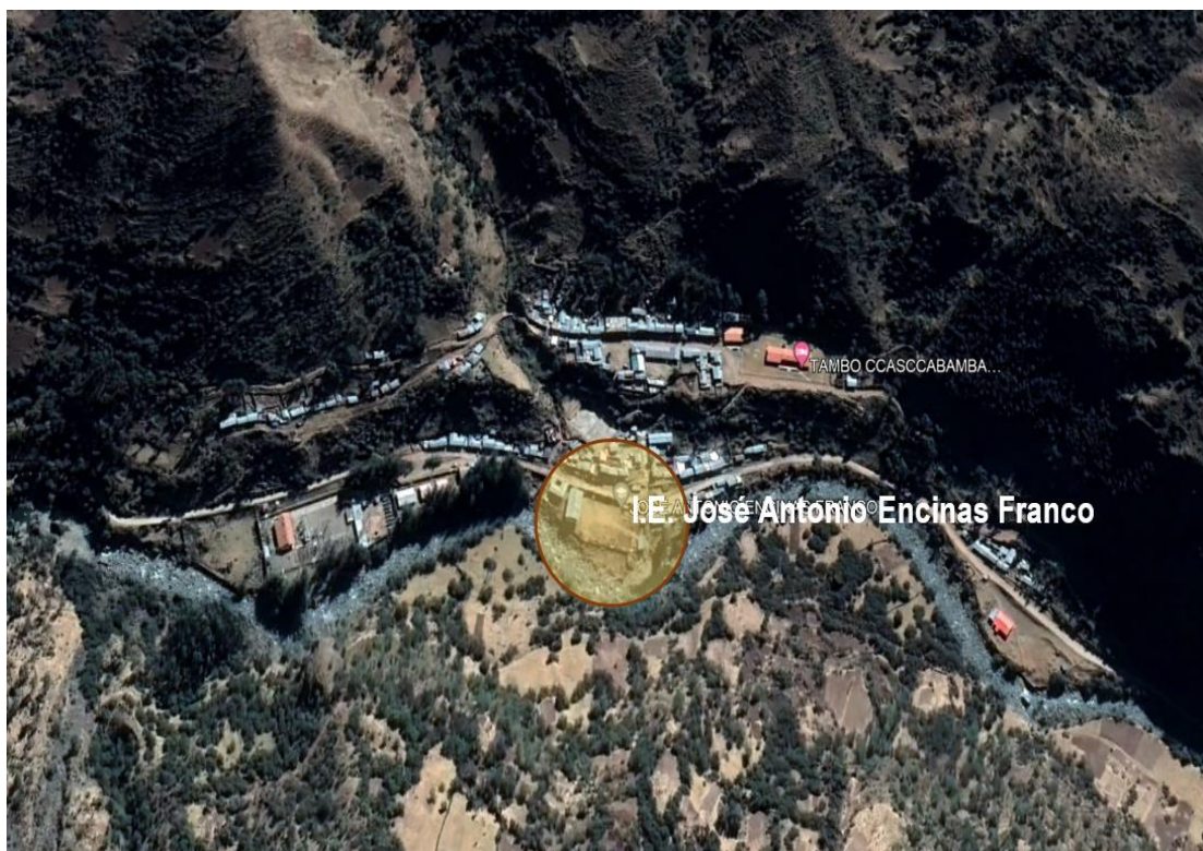
Figura 3: Ubicación de la I.E. José Antonio Encinas Franco