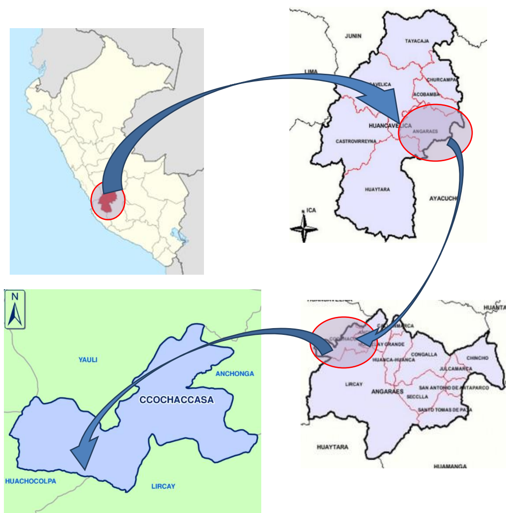
Figura 1: Macro localización de la zona del proyecto de inversión

Departamento : Huancavelica Provincia : Angaraes Distrito : Ccochaccasa Centro Poblado : Ccasccabamba Yuraccrumi Llamocca Palcas Zona : Rural