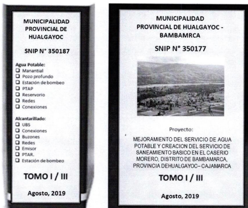
Figura 01: Forma de Presentación del Expediente Técnico (Referencial)