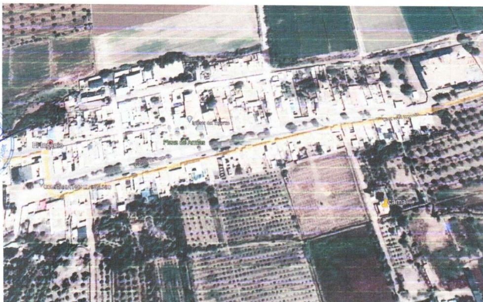
Foto N° 1: Vistas panorámica de la localidad de El Ingenio, capital del distrito.