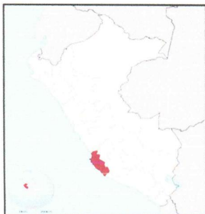
a) Ubicación del Dpto. de Ica