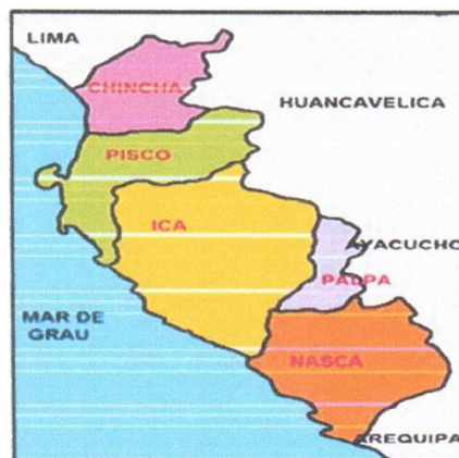
b) Ubicación del Dpto. de Ica