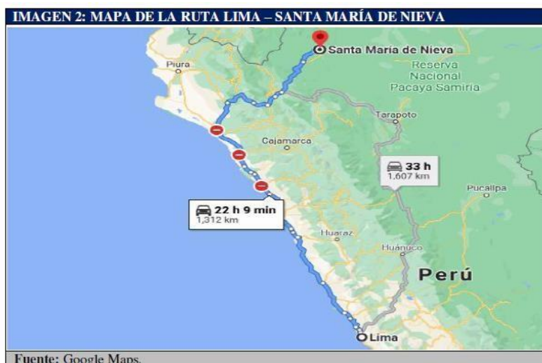
Cuadro - 02: Mapa de la ruta Lima - Santa María de Nieva