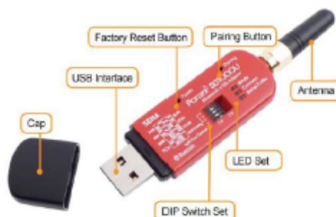
Figura N°03: Adaptador USB Bluetooth compatible con ADCP