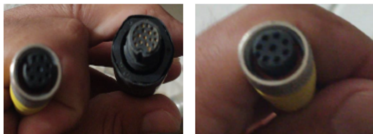
Figura N°02: Conectores del cable de conexión ADCP antena GPS