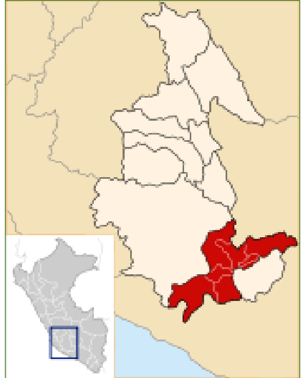
Ilustración 02: Ubicación de la provincia de Parinacochas