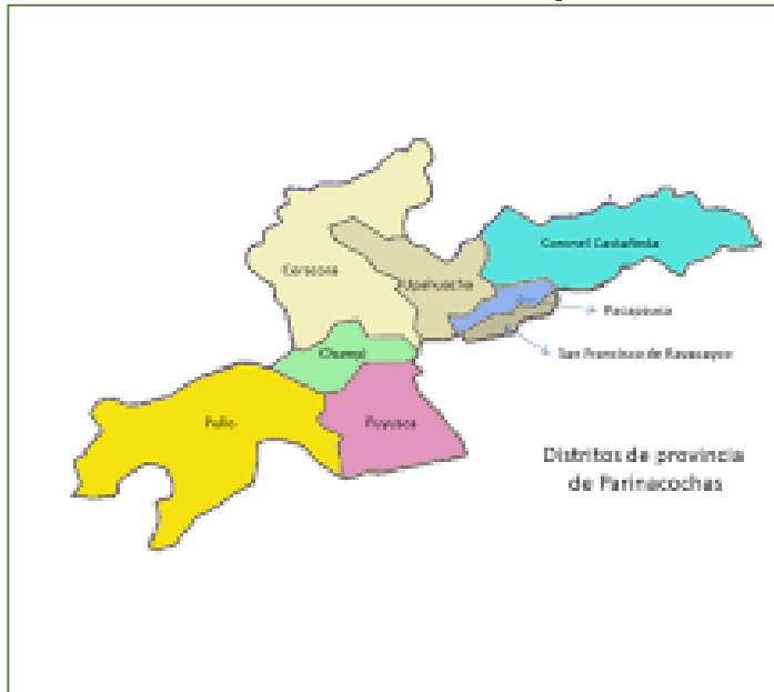
Ilustración 03: Ubicación del distrito de Chumpi