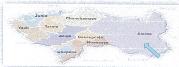
Figura 3. Mapa de ubicación del Distrito de río tambo