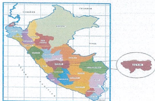
Figura 2. Mapa de ubicación de la Provincia de Satipo