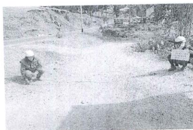
Inicio del tramo km 0+000