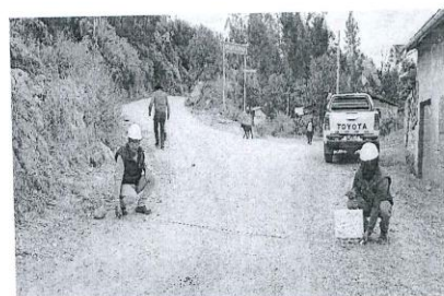
Fin del tramo km 12+000.