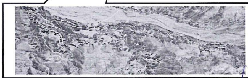
Ubicación del distrito de Estique