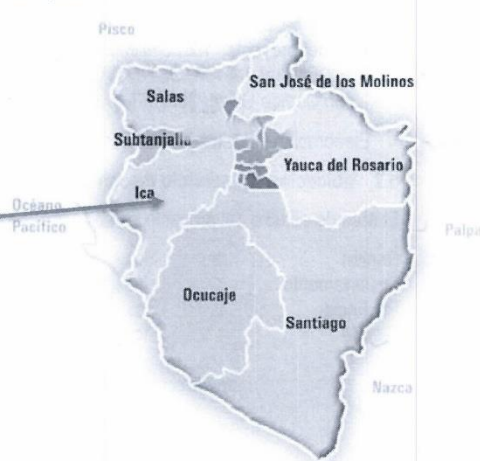
Imagen N° 3: Mapa de Ubicación del distrito beneficiario