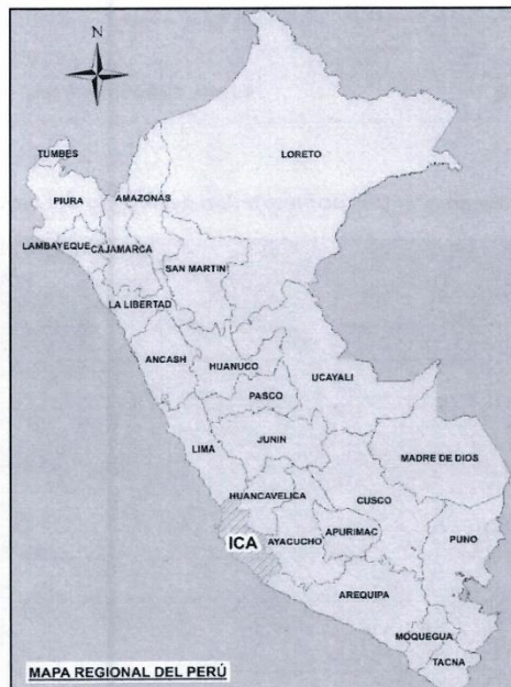
Imagen N° 1: Mapa de Ubicación de la Región de Ica

Región : Ica Departamento : Ica Provincia : Ica Distrito : Ica