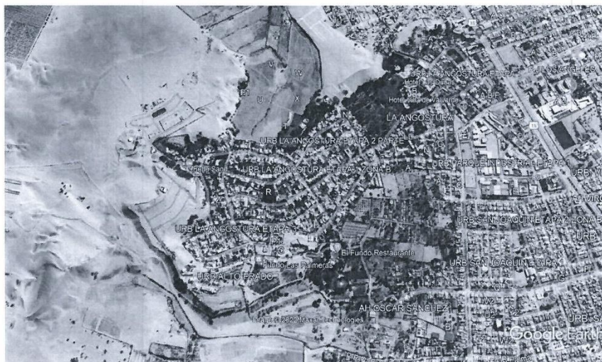
Imagen N°4: Ubicación satelital del ámbito del proyecto

El Consultor debe, en coordinación con la inspección de la Municipalidad Provincial de Ica, la Subgerencia de Estudios y Proyectos adscrita a la Gerencia Regional de Infraestructura del Gobierno Regional de Ica, complementar (incorporar) las nuevas habilitaciones no consideradas en la Preinversión, que se encuentren dentro del área de estudio, asimismo señalamos que la información proporcionada en cuanto al número de lotes, son referenciales , debiendo ser verificadas y actualizadas por el Consultor en el trabajo de campo a desarrollar: toma de encuestas, reuniones con los pobladores, dirigentes de las