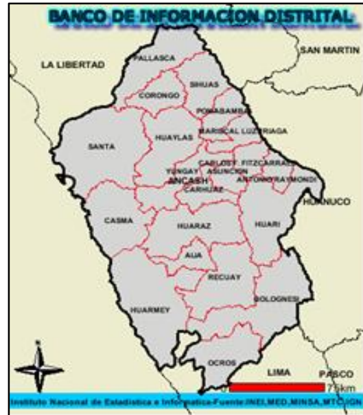
DPT. DE ANCASH