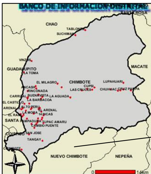
PROV. DEL SANTA