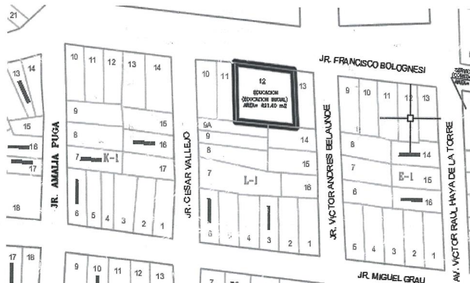
Imagen N° 02: Mapa de ubicación de la I.E.I.