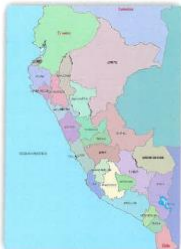
UBICACION POLITICA: PERU

GOBIERNO REGIONAL AYACUCHO GERENCIA REGIONAL DE INFRAESTRUCTURA SUB GERENCIA DE SUPERVISIÓN Y LIQUIDACIÓN