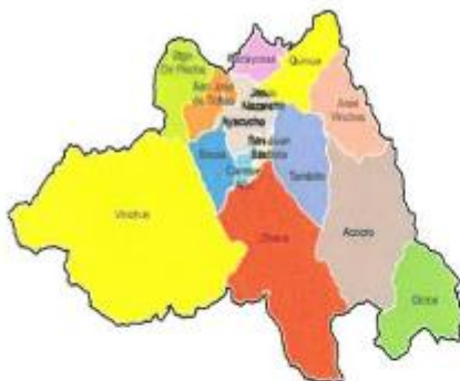
UBICACION PROVINCIAL: HUAMANGA