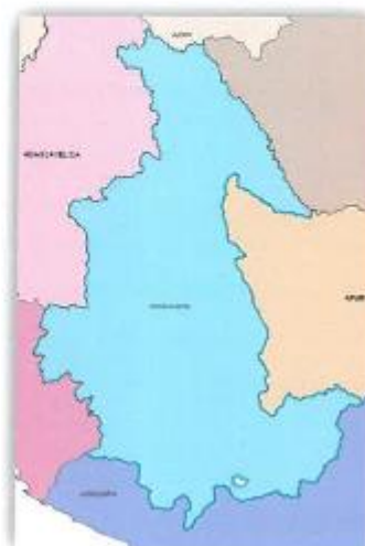
UBICACION DEPARTAMENTAL: AYACUCHO