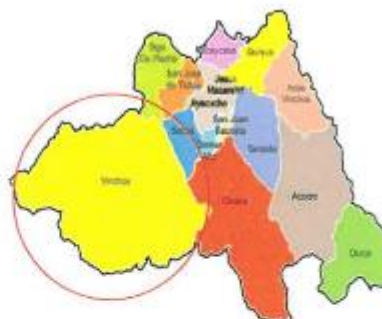
UBICACION DISTRITAL: VINCHOS