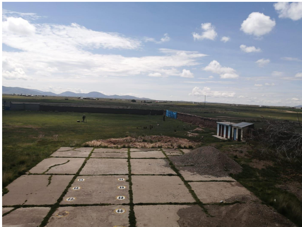
FIGURA: Se puede observar el deterioro de la losa deportiva de la institución educativa.