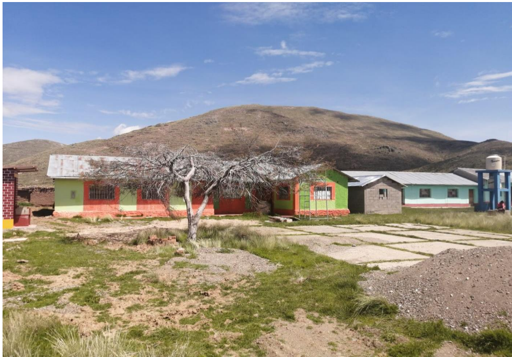
FIGURA: Se puede observar los ambientes que constituyen la institución educativa