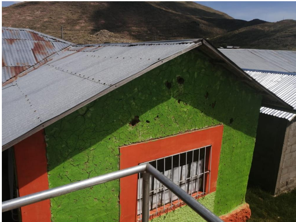
FIGURA: Se puede observar el deterioro en los muros de adobe de los ambientes.