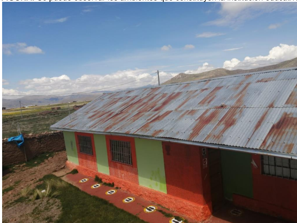
FIGURA: Se puede observar el deterioro de la cobertura de los ambientes.