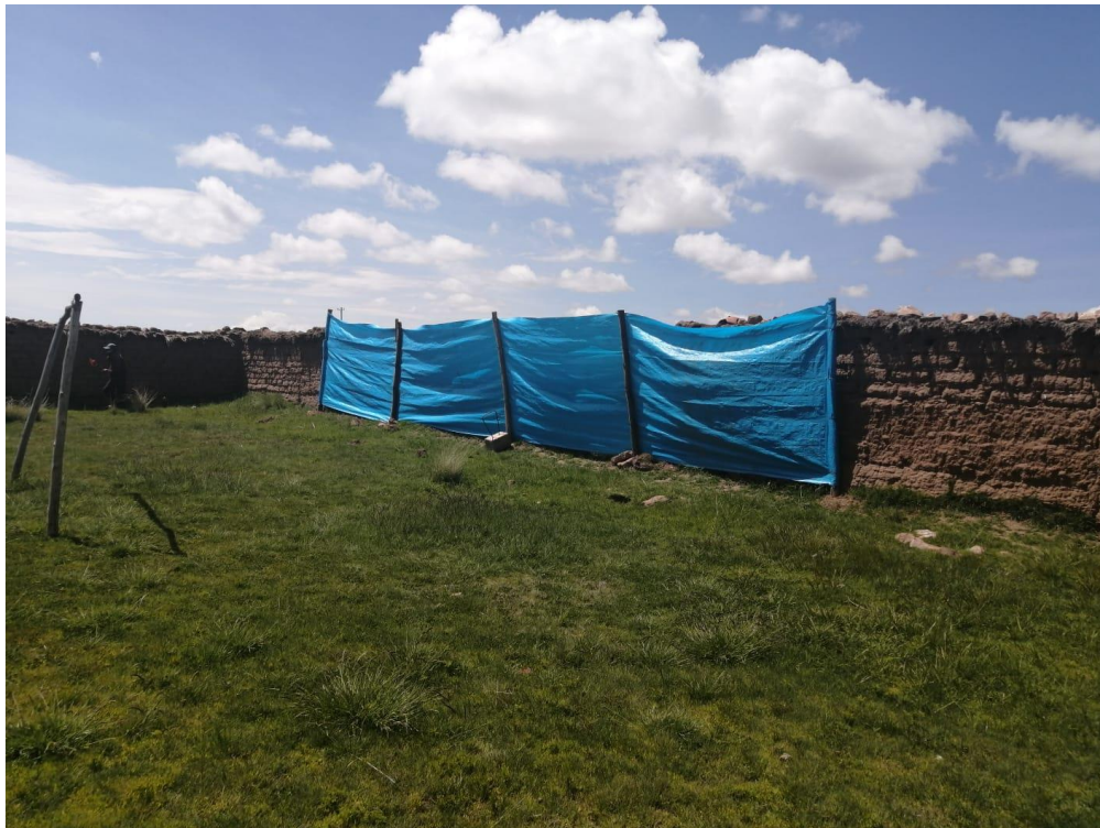
FIGURA: Se puede observar el mal estado del cerco perimetrico de la institución educativa.