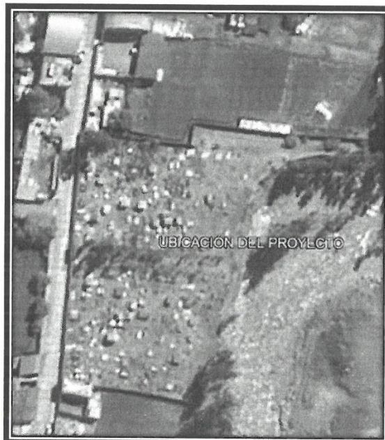
Grafica N°03 Micro localización del Proyecto

La Municipalidad Distrital de Chavín De Huántar, a través de la Gerencia de Desarrollo Urbano Rural, y la Sub Gerencia de Estudios, Proyectos y Liquidaciones, unidad ejecutora tiene como una de sus competencias ejecutar y supervisar obras de infraestructura y contando con el perfil aprobado del proyecto "Mejoramiento y Ampliación del Campo Santo de la Localidad de Chavin de Huántar del Distrito de Chavin de Huántar - Provincia de Huari - Departamento de Ancash, se propone como Unidad Ejecutora encargar la elaboración del expediente técnico del proyecto mencionado, el actual cementerio se encuentra en mal estado ya rebasó su capacidad y que se estima que para finales del año 2021 ya no se contará con espacio para más sepelios, además presenta una serie de problemas en su infraestructura que repercuten en aspectos sanitarios. Debido a lo anterior las autoridades deciden ejecutar el proyecto con las tendencias actuales que rigen este tipo de infraestructura.