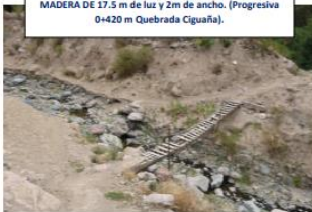
Figura n°02: PUENTE PEATONAL EXISTENTE

PUENTE PEATONAL TOME PAMPA PROVISIONAL DE MADERA DE 17.5 m de luz y 2m de ancho. (Progresiva 0+420 m Quebrada Ciguaña).