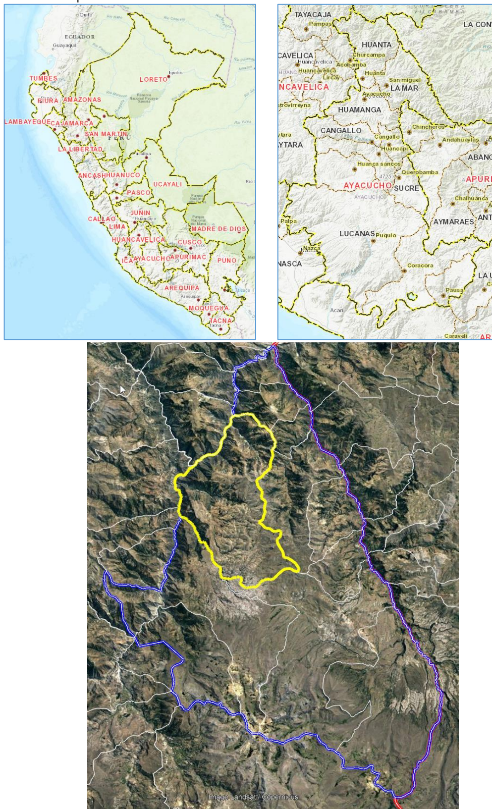
Mapa N° 1: Macro Localización - Ubicación de la Provincia de Sucre