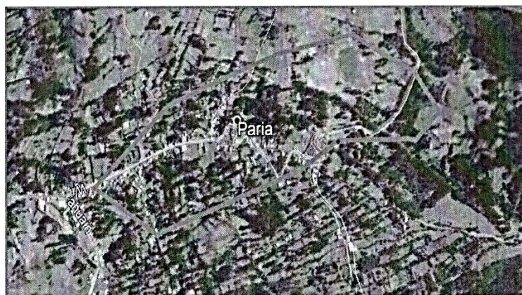
Imagen N° 02: Micro localización del proyecto– Zona de intervención del proyecto.