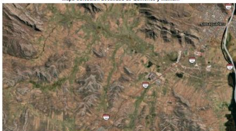
Mapa Ubicación Localidad de Quiñones y Mamani