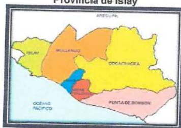
Figura N° 02 Provincia de Islay

El Distrito de Mejía geográficamente presenta los siguientes límites: