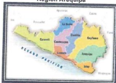
Figura N° 01 Región Arequipa

El territorio de Mejía está constituido por una extensión de 100.78; Km² que en relación a la provincia de Islay representa el 2,59%; esta superficie considera la Zona Urbana, rural, áreas de cultivo, terrenos eriazos, zonas de playa, terrenos pantanosos y de pastos, la mayor parte conformada por terrenos eriazos sobre los 75 m.s.n.m.