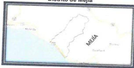
Figura N° 03 Distrito de Mejía

El CONSULTOR, para elaborar el estudio debe tener en cuenta OBLIGATORIAMENTE la versión vigente de las normas y manuales siguientes: