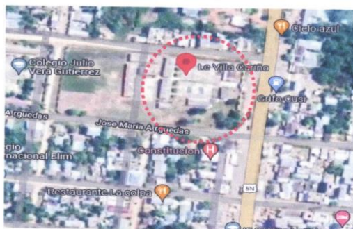
vista panorámica de la I.E. Villa Cariño