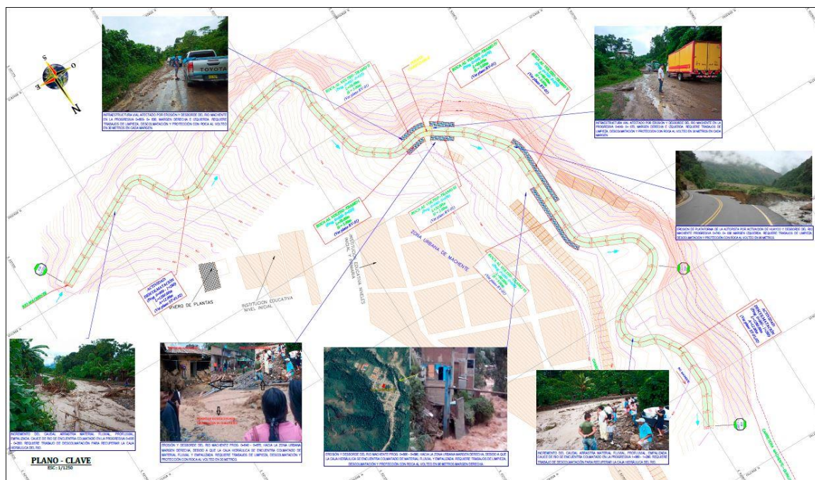
Imagen N° 1: Tramos a intervenir en el río Machente.