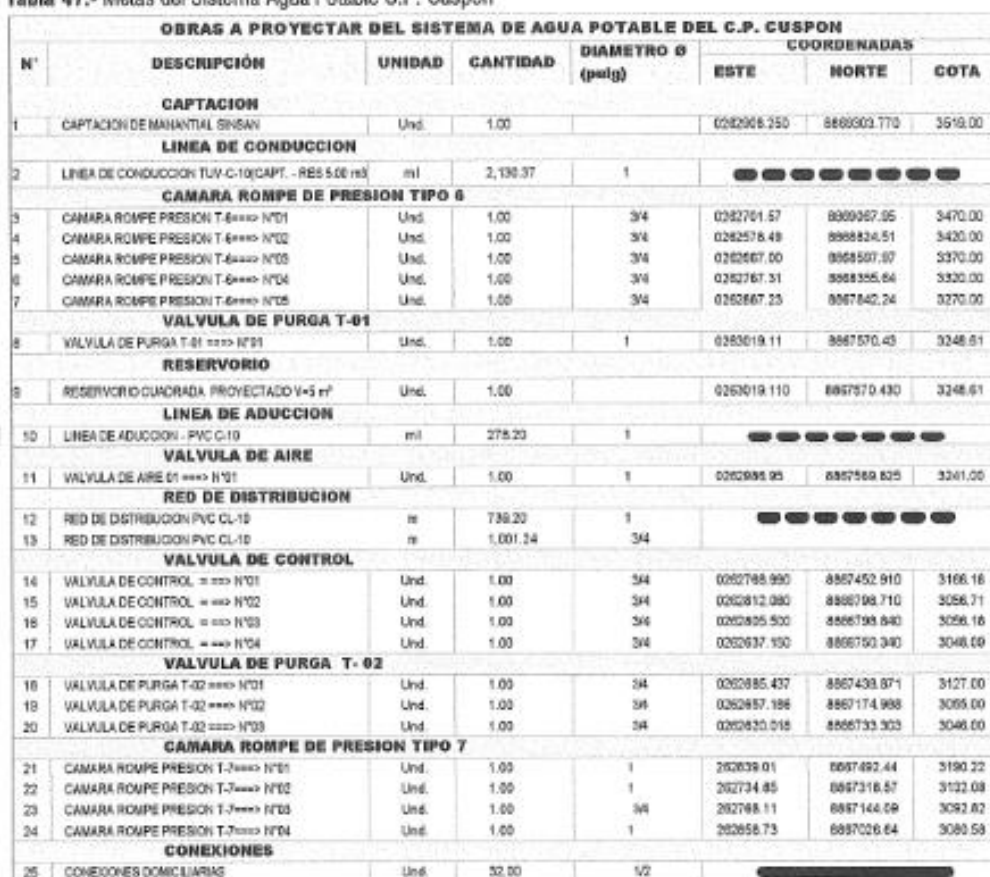
Tabla 47.- Metas del Sistema Agua Potable C.P. Cuspon