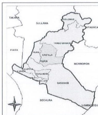
DISTRITO DE CASTILLA