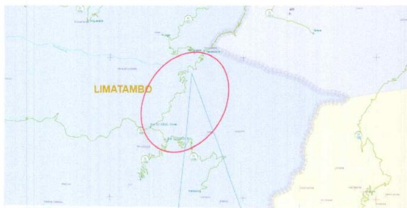
Camino Vecinal: Pampahuaylla (Km 05+495)- Desvio Chonta (Km 13+240)

El contratista debe cumplir los siguientes requisitos: