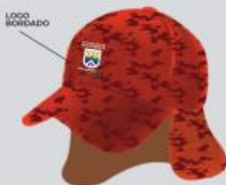
GORRO DE PERFIL