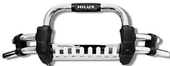
Figura referencial defensa delantera