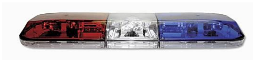
Figura: Barra de luces referencial