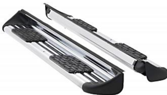
Figura: estribos laterales es referencial