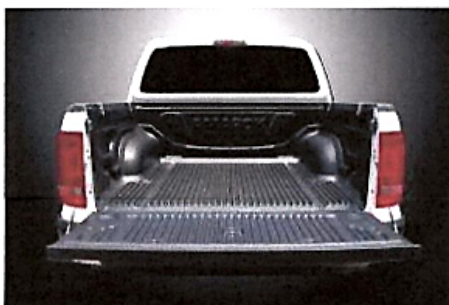
Figura referencial de protector de tolva