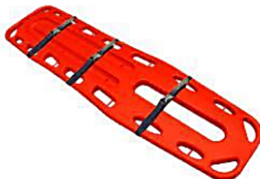
Figura referencial de camilla