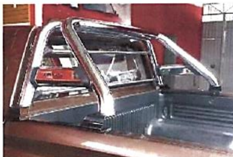
Figura referencial de sistema antivuelco