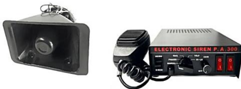
Figura: Sirena con alta voz referencial