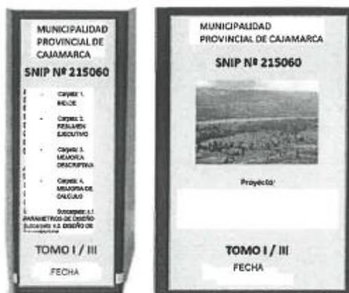
Figura 1. Forma de presentación del Expediente

El contenido máximo de folios por cada archivador será de 200 páginas, salvo cuando el límite obligara a dividir escritos o documentos que constituyan un solo requisito, en cuyo caso se mantendrá su unidad. Por ejemplo, un solo requisito puede ser el Estudio de Mecánica de Suelos. En esos casos, estos documentos no deberán ser divididos en diferentes tomos, deben mantenerse en uno solo.