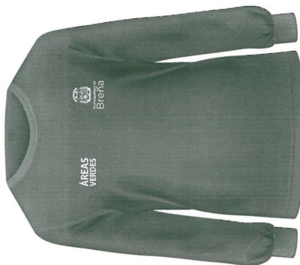
Pieza : Polo manga larga