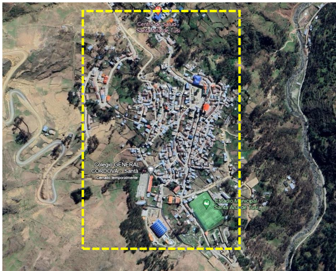
FIGURA N° 2 UBICACIÓN GEOGRÁFICA DEL PROYECTO

El presente Proyecto a ejecutarse se encuentra en el Distrito de Santa Ana de Tusi, está ubicada en una altitud aproximada de 3760.00 msnm. El Distrito de Santa Ana de Tusi es uno de los distritos que conforman la provincia de Daniel Alcides Carrión, perteneciente a la Región Pasco.