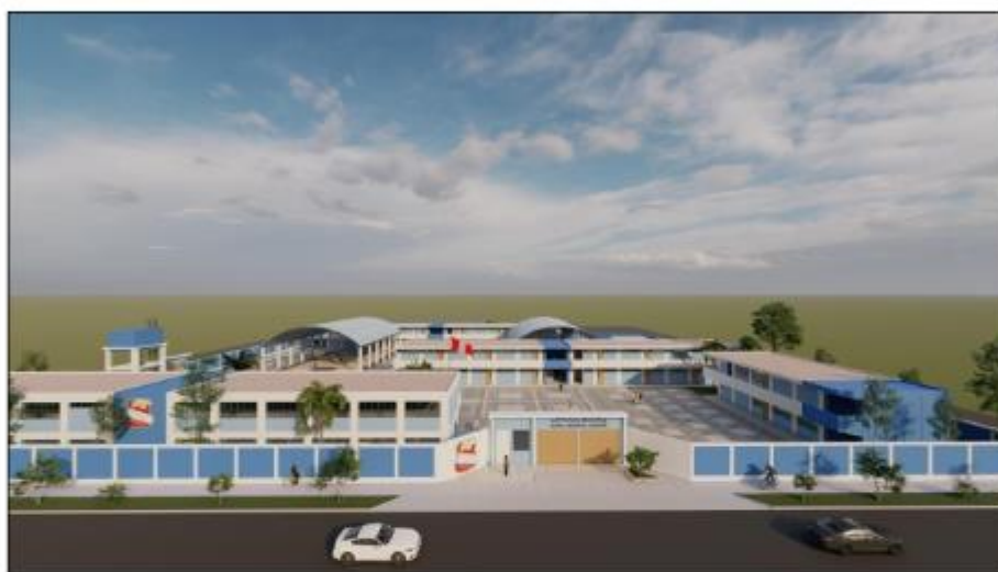
Imagen 3d De La Propuesta Arquitectónica