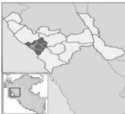
FIGURA 1: Departamento La Libertad

Región : La Libertad Provincia : Trujillo Distrito : Trujillo Latitud : -8.10709 Longitud : -79.0071 Altitud : 37 m.s.n.m.