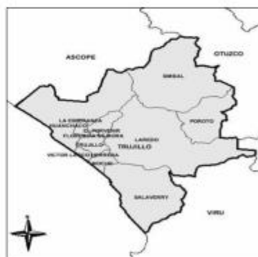
FIGURA 2: Provincia de Trujillo