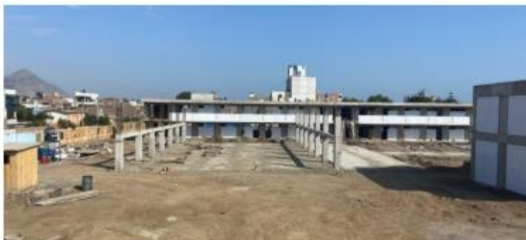
Imagen: Situación Actual de la institución Educativa