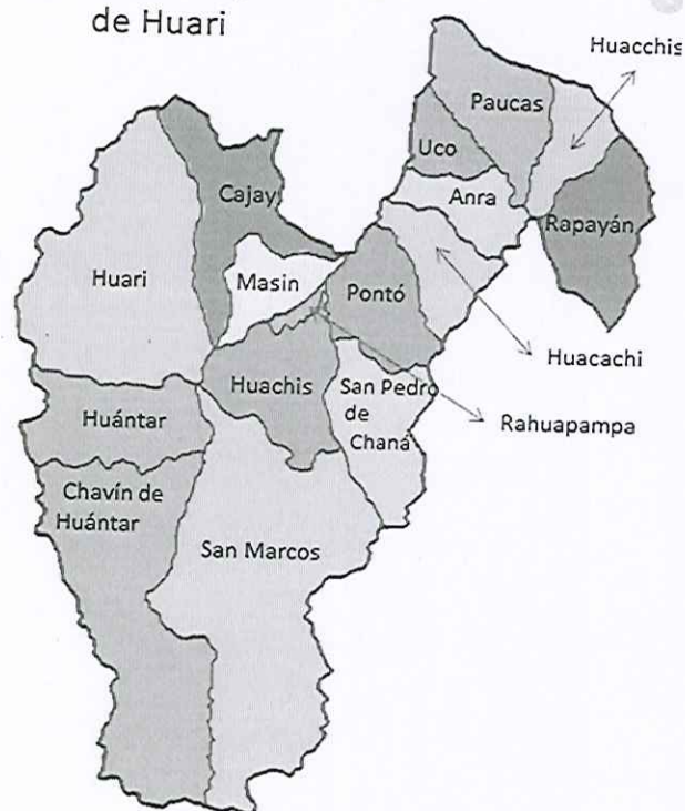
GRÁFICO N° 02