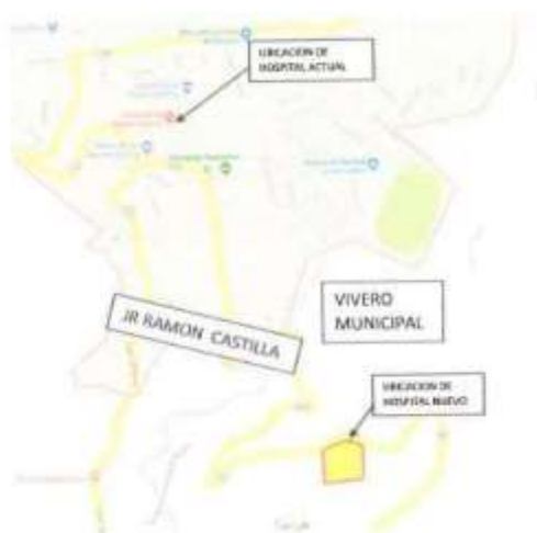
Ubicación de Terreno para nuevo Hospital.