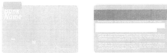
Ilustración 1: Imagen referencial