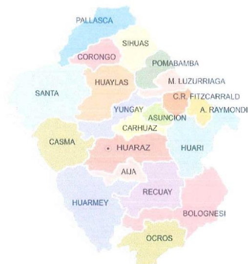
Imagen N°1: Ubicación de Ancash.

MUNICIPALIDAD DISTRITAL DE BUENAVISTA ALTA GUSTAVO LEONARDO REYES LUNA GERENCIA DE INFRAESTRUCTURA DE SANEAMIENTO RURAL Y OBRAS