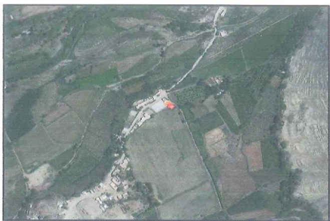
Imagen N°4: Ubicación de la Zona de Intervención en El Olivar Alto - Buenavista Alta.

El acceso de la vía desde la ciudad de Casma es a través de la carretera con dirección a Buenavista Alta y luego seguimos con dirección al sector el Olivar Alto.