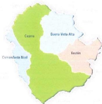
Imagen N°3: Ubicación del Distrito de Buenavista Alta.

MUNICIPALIDAD DISTRITAL DE BUENAVISTA ALTA