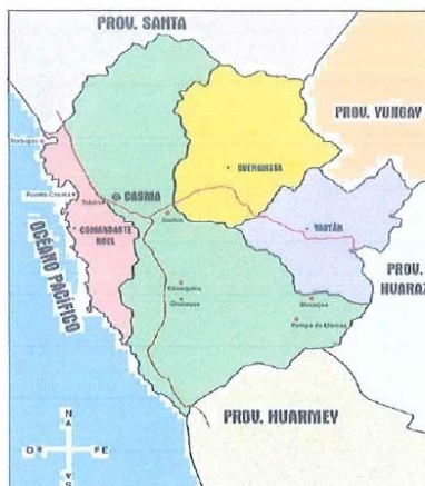
Imagen N°2: Ubicación de la Provincia de Casma.