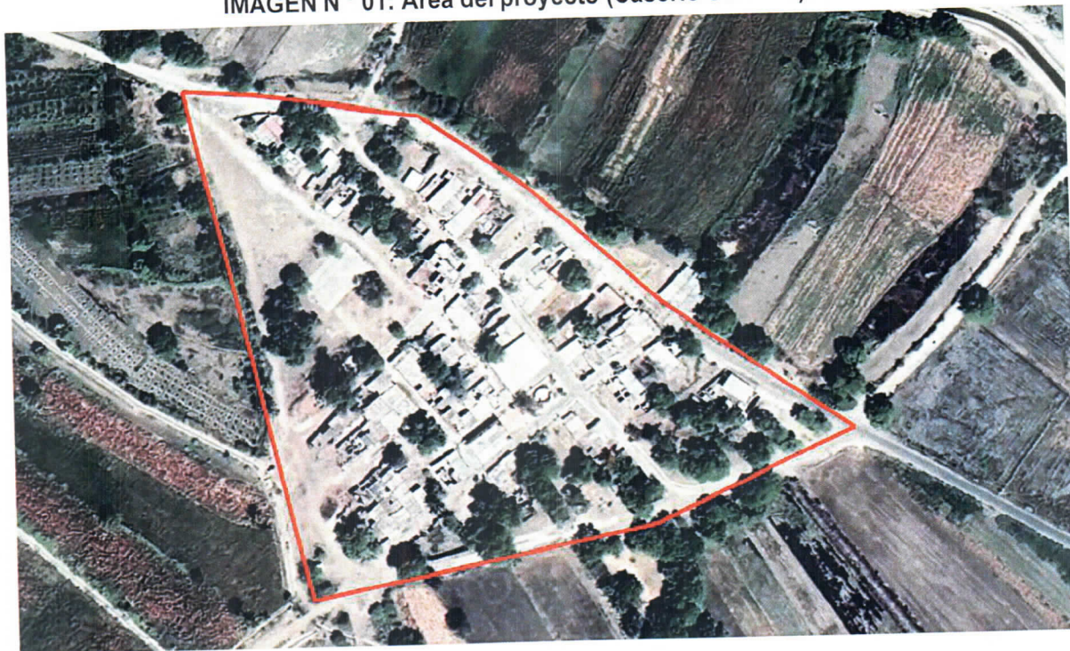
IMAGEN N ° 01: Área del proyecto (Caserío Soledad)