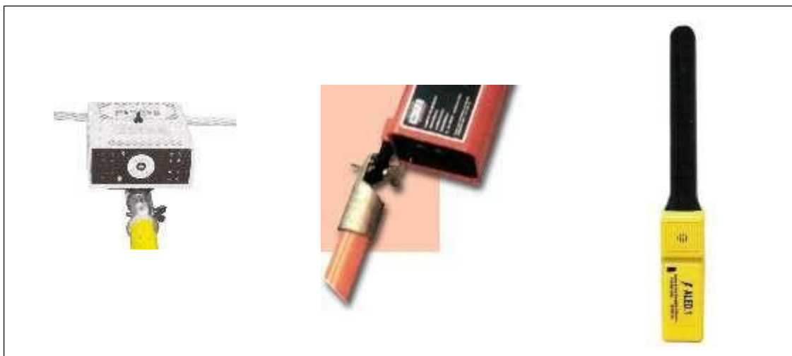
Fig8. Verificador de ausencia de tensión.