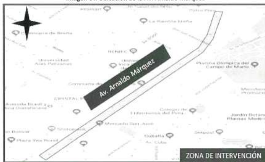
Imagen 01: Ubicación de la Av. Arnaldo Márquez

El proyecto se ubica en las coordenadas, cuyos datos técnicos se detallan en el siguiente cuadro datum WGS 84 zona 18S: