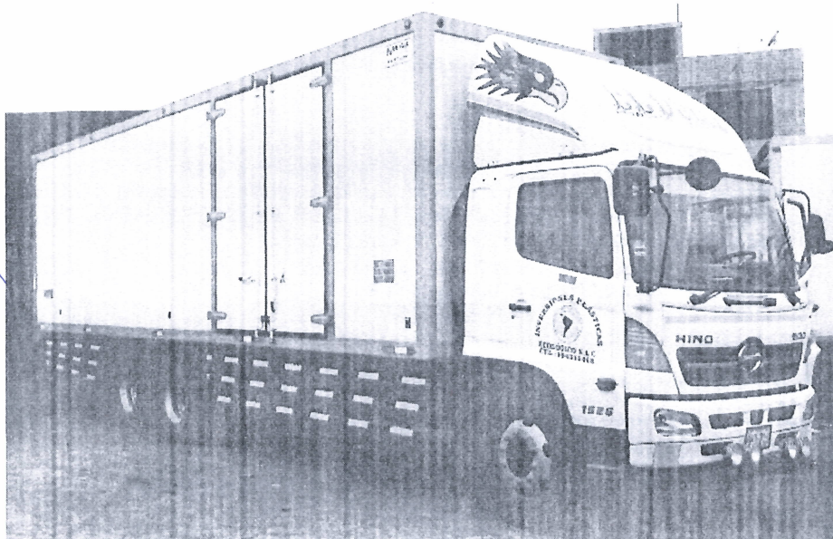
Imagen referencial, no condiciona modelo ni marca.