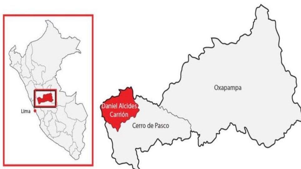
FIGURA N° 1 UBICACIÓN DEL PROYECTO