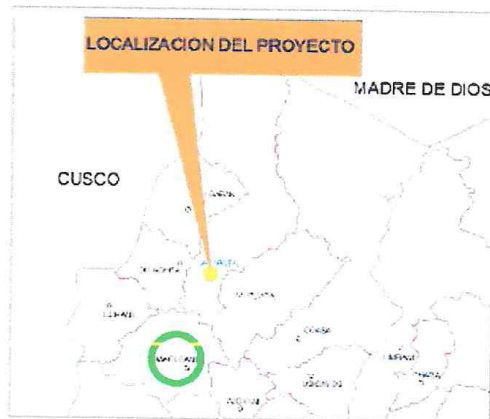
Fig. N° 03: Ubicación Distrital de la zona del Estudio