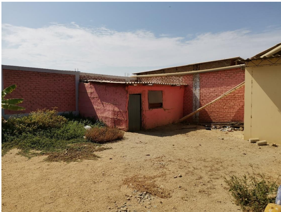
VISTA DEL AREA DESTINADA