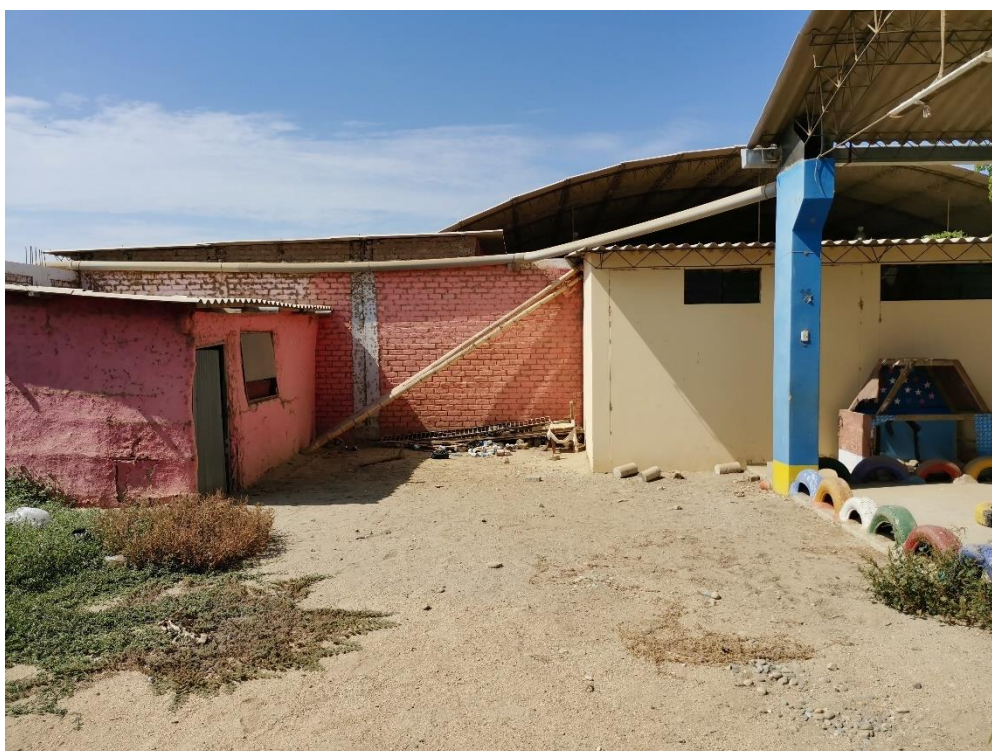
VISTA DEL TERRENO PROPUESTO