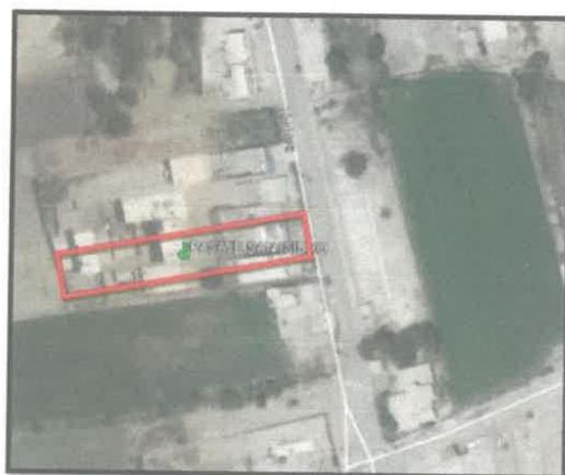
MAPA 4: UBICACIÓN DEL PROYECTO

COORDENADAS UTM – SISTEMA WGS 84 : ( 214,915.00 E – 8, 772,373.