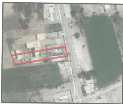
MAPA 4: UBICACIÓN DEL PROYECTO

COORDENADAS UTM – SISTEMA WGS 84 : ( 214,915.00 E – 8, 772,373.