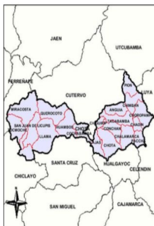
Provincia de Chota