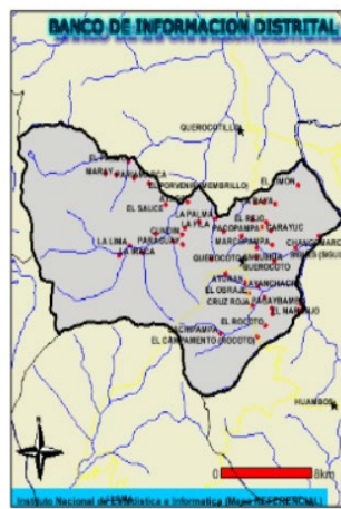
Distrito de Querocoto