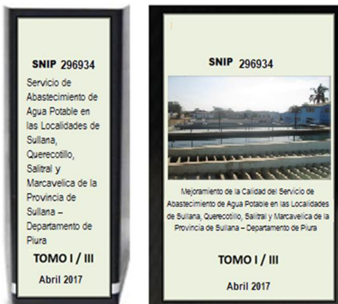
Ilustración 1: Modelo de Presentación del Expediente Técnico