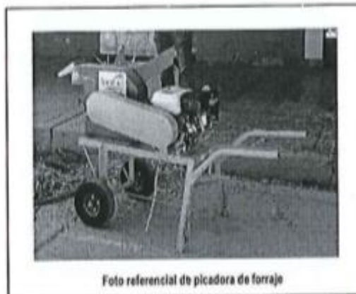
Foto referencial de picadora de forraje