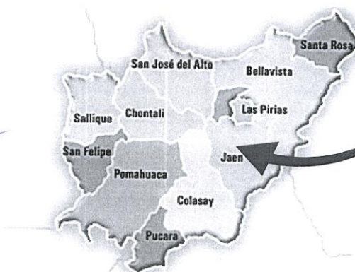
Ilustración Micro localización del proyecto